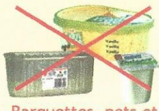
Barquettes, pots et sachets plastiques