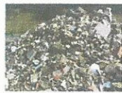
gravats, déchets de démolition