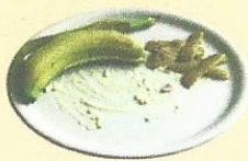
Déchets fermentescibles (restes de repas, épluchures, ...) sauf si vous disposez d'un composteur individuel.