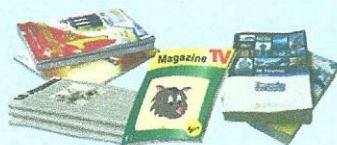
Tous les papiers, à l'exception des papiers souillés ou gras