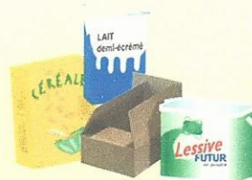
Cartons, cartonnettes et briques alimentaires