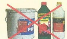
Produits de jardinage et de bricolage