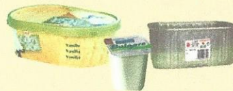
Barquettes, pots et sachets plastiques