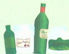
Les bouteilles, pots et bocaux en verre à l'exception de la vaisselle, des ampoules et néons