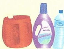
Plastiques : uniquement les bouteilles et les flacons