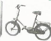
encombrants, électroménager, ordinateurs, téléviseurs, ...